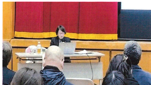
【津久井・相模湖地区向け研修】