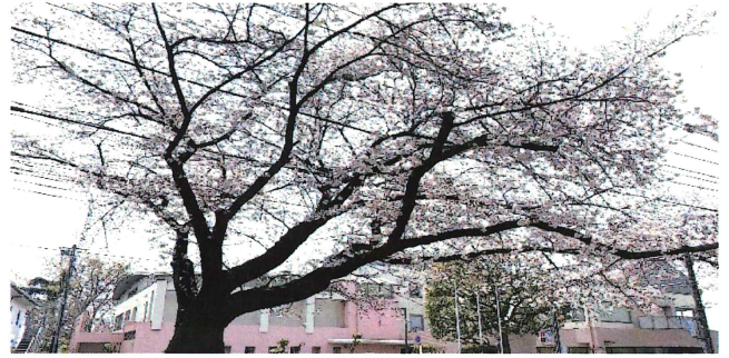
【桜のひととき、ちょっと得した気分 3/31撮影】