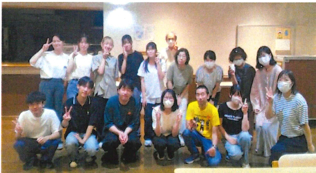
【交流会～終始笑顔が溢れる空間でした～】