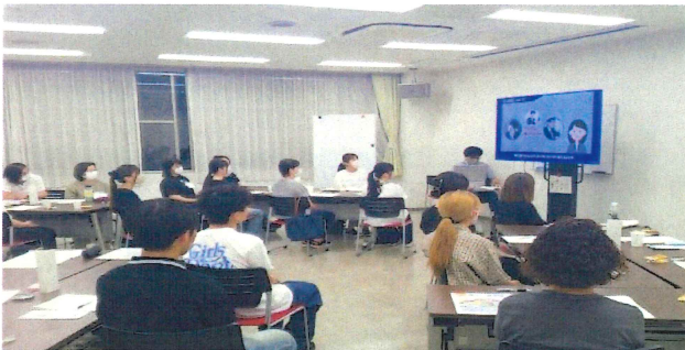
【非常勤職員向け研修会～真剣な表情で参加～】

来年度も、非常勤職員を含めた研修会と交流会を開催し、職員が一丸となって、利用者の安心安全で楽しめる空間作りに繋げられるよう努めていきます。