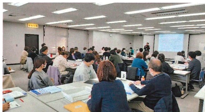
【強度行動障害支援者養成研修】