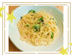
サーモンクリームパスタ ¥850