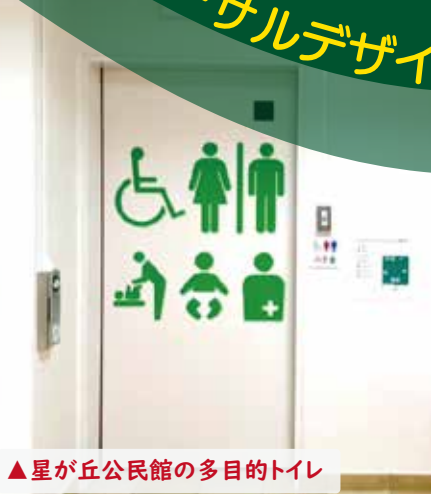
▲星が丘公民館の多目的トイレ