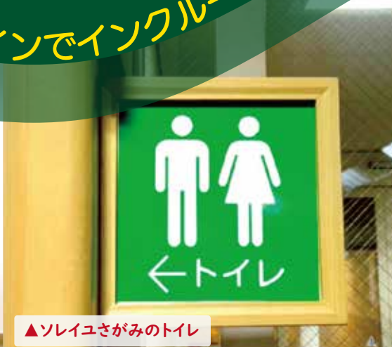
▲ソレイユさがみのトイレ