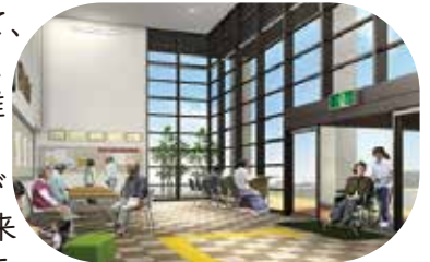
▲星が丘公民館ロビー

エコ駐車場になって、雨の日のぬかるみや、芝生の手入れなど、維持管理の手間は増えますが、そこからUDが根付いていく地域・未来の姿が見えてきそうです。