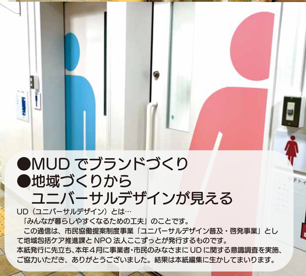
◀星が丘公民館の男女トイレ ▼誰でも使える「Dトイレ」