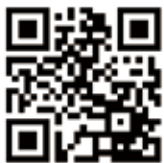
Uni-Voice Blind のアプリ インストールQRコード