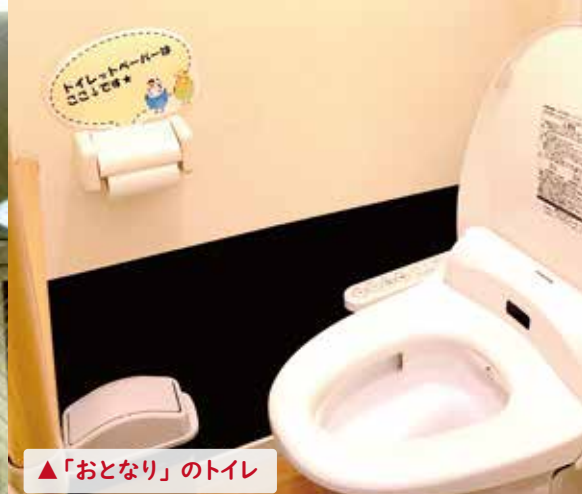
▲「おとなり」のトイレ