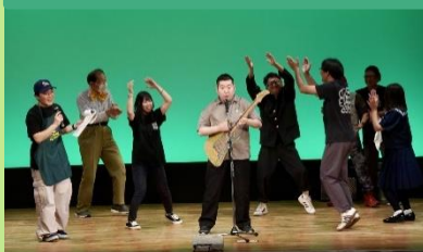
▲大盛り上がりだった一発芸メドレー

超個人的に注目していたのは、けやきの会メンバーによる一発芸メドレー。独特なクオリティによる「自分らしさ」をステージ上で十二分に披露されていました。また来年が楽しみです!!