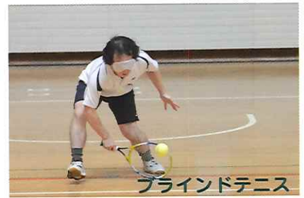
ブラインドテニス