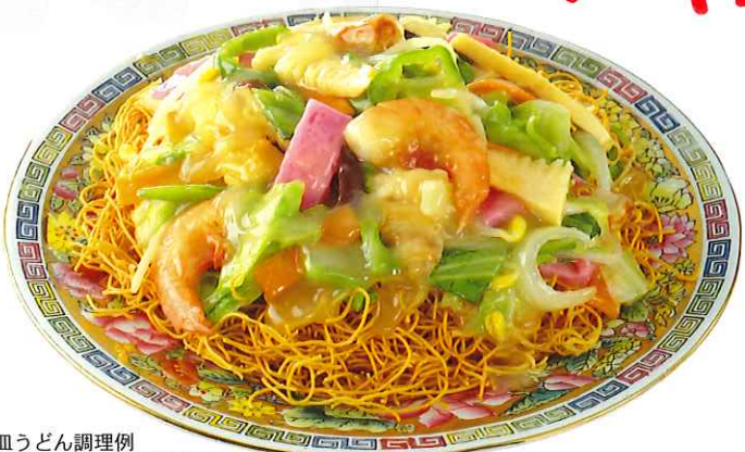
血うどん調理例 具材はついておりません