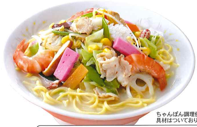
ちゃんぽん調理例 具材はついておりません