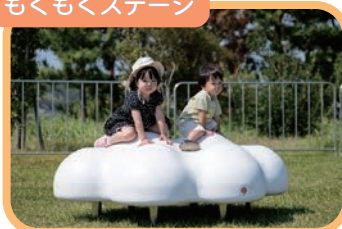
もくもくステージ