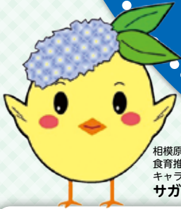
相模原市 食育推進マスコット キャラクター サガピー