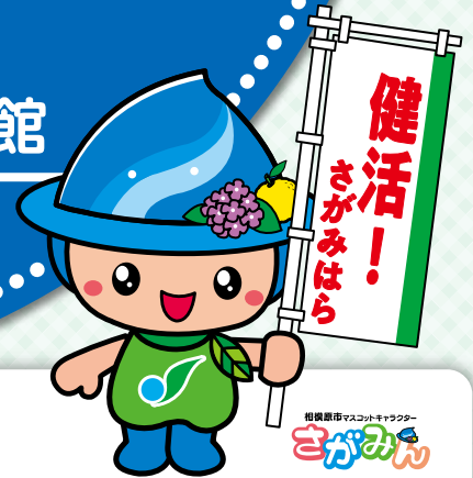
相模原市マスコットキャラクター さがみん