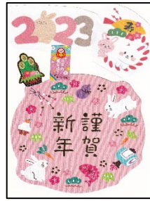
倉田さんへ家族より