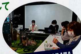
CINEMA Chupki TABATA

■ 視覚障がいの方のための音声ガイド、 聴覚障がいの方のための字幕をこれまでも協働してきた シネマ・チュブキ ※ さんとともに制作に取り組みました。 いつも思うことですが、音声ガイドと字幕をつくることで わたしたちは、より深く上映作品と出会えます。つくっていく過程のそのなかで このまちのひとつとともに映画鑑賞する思いも熱くなっていくのです。ぜひ、ごいっしょに、と。 ※シネマ・チュブキ・タバタ=田端にある日本で唯一のユニバーサル映画館です。