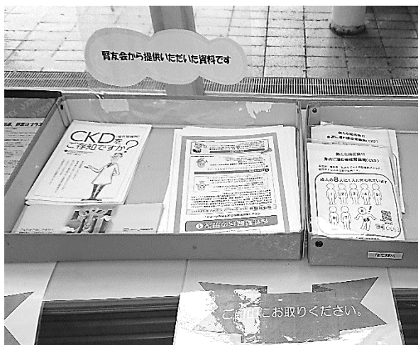
<腎友会が提供した展示物>

予防のためのイベントは関係ない、とお考えの方もいらっしゃるでしょう。相模原市腎友会の会員は、すでに透析に入られた方がほとんどですから。しかし、相模原市腎友会では【さがみはら健康づくり会議】(相模原市健康増進課を事務局とする健康のための市民団体の集まり)のなかで、毎年10月の【健康フェスタ】で北里大学の先生をお招きし、腎臓病の講演会を開いて、市民の皆さまのための予防活動にも力を入れております。