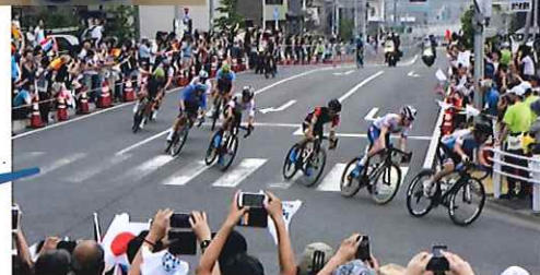
自転車ロードレース