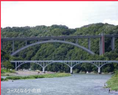
コースとなる小倉橋

※スタート：武蔵野の森公園(東京都)からゴール：富士スピードウェイ(静岡県)に至るコース