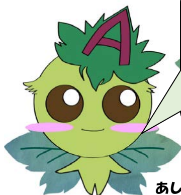
あしたば会新キャラクター「あしたばちゃん」