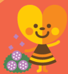
「サボちゃん」 さがみほろ公式キャラクター