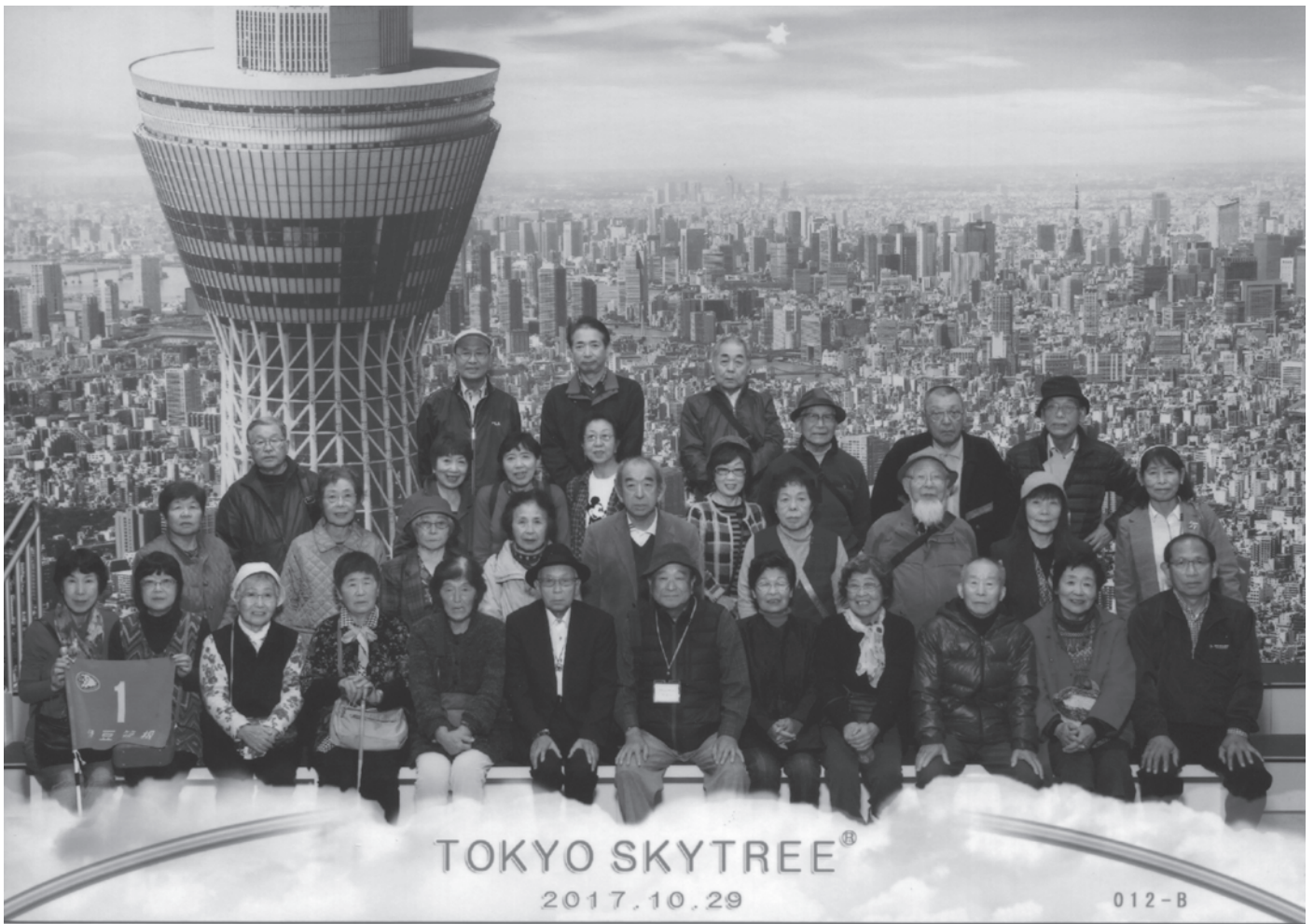
「東京スカイツリー」と「とげ抜き地藏」の旅 1号車