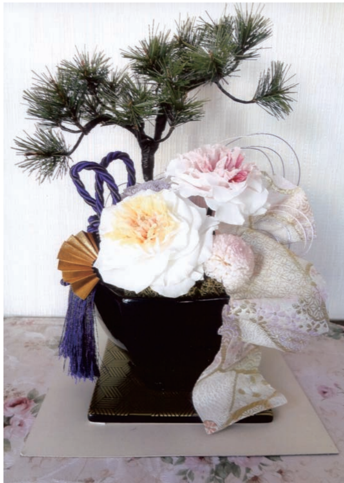
本物の薔薇の花で「プリザーブドフラワー」 橋本クリニック 江口 房子様