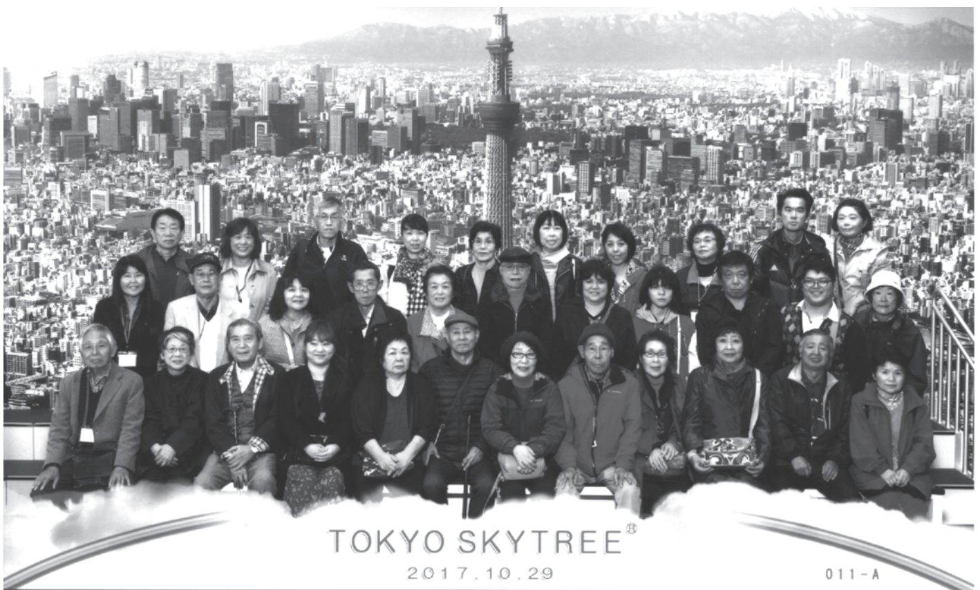
「東京スカイツリー」と「とげ抜き地藏」の旅 2号車