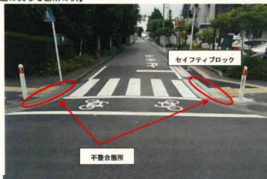
【構造の異なる箇所の例】

兼ねてより、路面と歩道との段差について、車椅子利用者、視覚しょうがい者他よりご意見をいただいた結果、従来の段差 2 cm を 5 mm とし、視覚障がい者がわかり易いように、セフティブロック（ゴム状の板）を設置することになりました。28 年度 7 月より、順次公共施設、駅周辺から改善工事を実施して行く事が、市路政課の担当者が NPO 法人れんきょう事務所に来訪され説明を受けました。